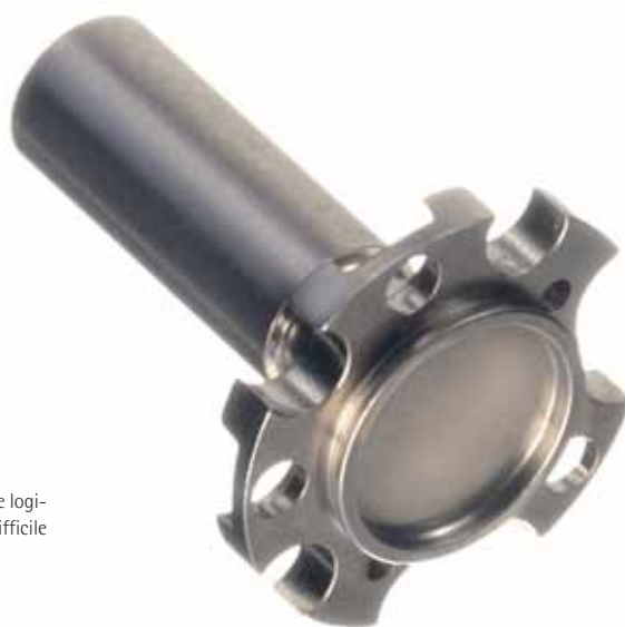
Pièce typique usinée chez Décovi. Sans le logiciel GibbsCAM, cette pièce serait très difficile voire impossible à programmer.