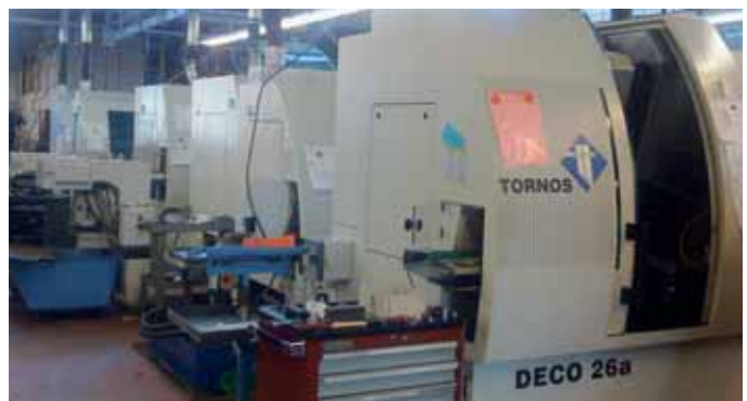
Vue partielle de l'atelier des DECO chez Décovi. Elles sont toutes reliées au système centralisé d'évacuation des vapeurs d'huile.

Claude Chèvre: L'utilisation du logiciel GibbsCAM est un investissement indispensable et très profitable. Son introduction nécessite néanmoins un pilotage interne strict et un fournisseur compétent. Il est très important de monter un projet avec un programme de formation préétabli et des étapes d'introduction bien définies dans les départements. Il ne faut pas négliger la planification du temps machine nécessaire pour tester et valider le fonctionnement des post-processeurs.