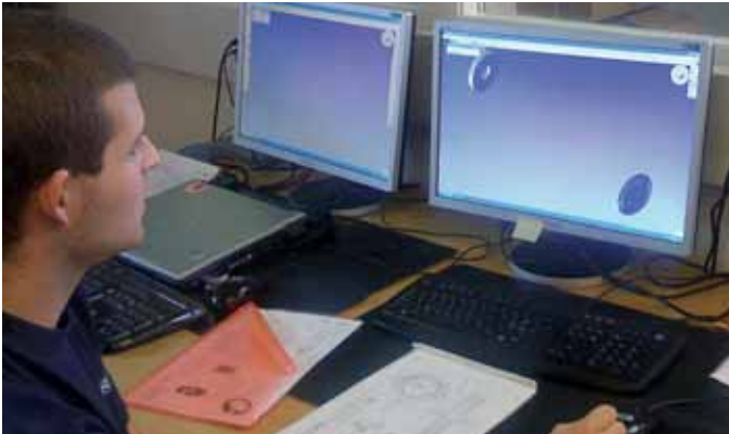
Poste de travail GibbsCAM chez Décovi. Doté de deux stations « pour garantir la souplesse », le département de programmation peut réagir avec rapidité et efficacité.